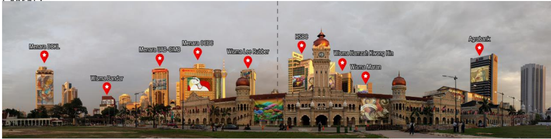
visual is for illustration purposes only

CENDANA dengan sukacitanya ingin menjemput penggiat-penggiat seni visual serata Malaysia untuk melibatkan diri dalam memberikan imej yang unik kepada bandararaya Kuala Lumpur sambil mempromosikannya sebagai destinasi budaya kreatif.