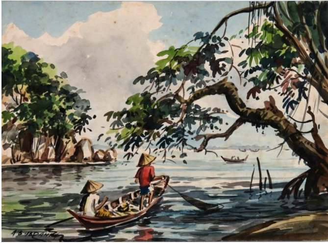
A.B. Ibrahim Menarik Jala 1950-70an Cat air atas kertas 28 x 38 cm 2006.123