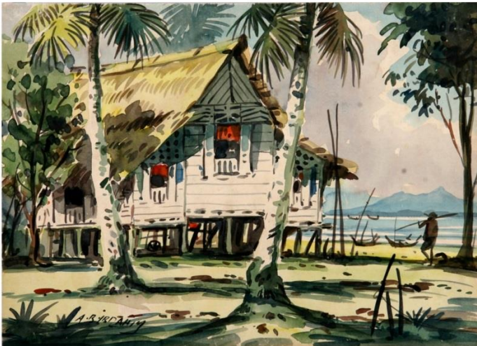
A.B. Ibrahim Rumah Langsir Merah 1950-70an Cat air atas kertas 28 x 38 cm 2006.116

Bagi mereka yang mengenali A.B Ibrahim dan lukisannya pastinya diingatan terbayang sawah padi yang terbentang, desa yang tenteram, para nelayan di tepian pantai bersifat panoramik, romantik dan suasana yang menyegarkan. Bertemakan pemandangan alam dan suasana perkampungan melayu dengan media cat air yang menarik dan mempengaruhi pelawat - pelawat luar negara terutama dari benua Eropah untuk mendapatkannya. Pemandangan yang dihasilkan oleh beliau tersiratnya kecantikan semulajadi yang menonjolkan identiti masyarakat dan suasana yang aman dan damai.