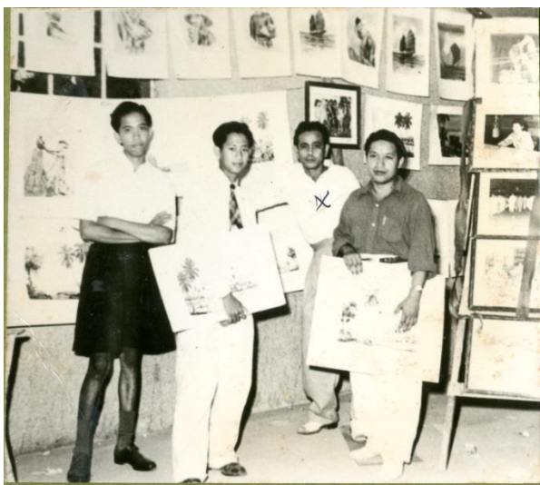
Hasil karya beliau semasa mengadakan pameran di Alor Setar, Kedah pada tahun 1960