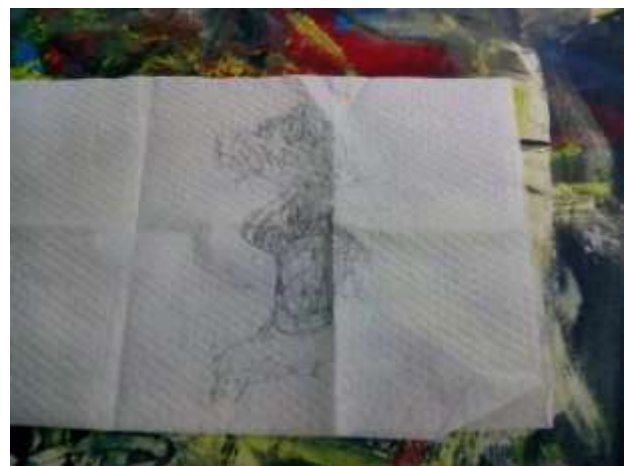
Rajah 3: Antara koleksi Amron Omar iaitu lakaran figura bersilat di atas tisu.